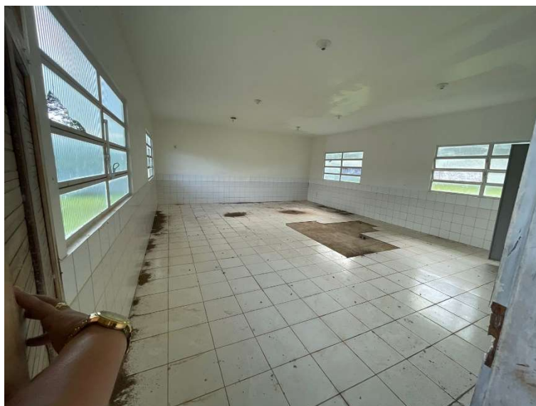
Imagem 08 – Sala de aula 02.