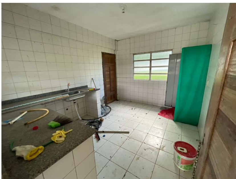
Imagem 03 – Cozinha.