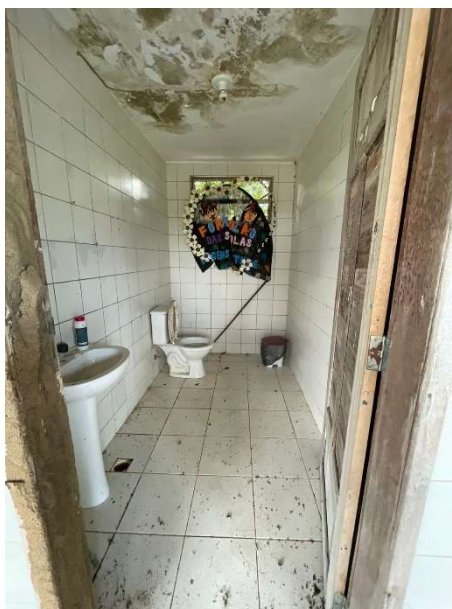
Imagem 05 – Banheiro feminino.