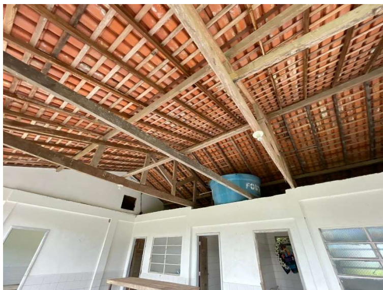
Imagem 06 – Reservatório de água elevado.