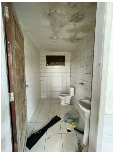
Imagem 04 – Banheiro masculino.