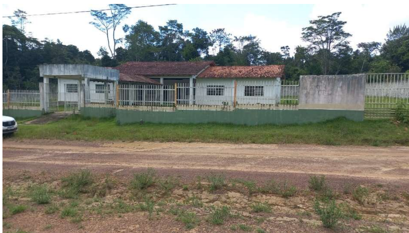
Imagem 02 – Vista frontal (fachada).