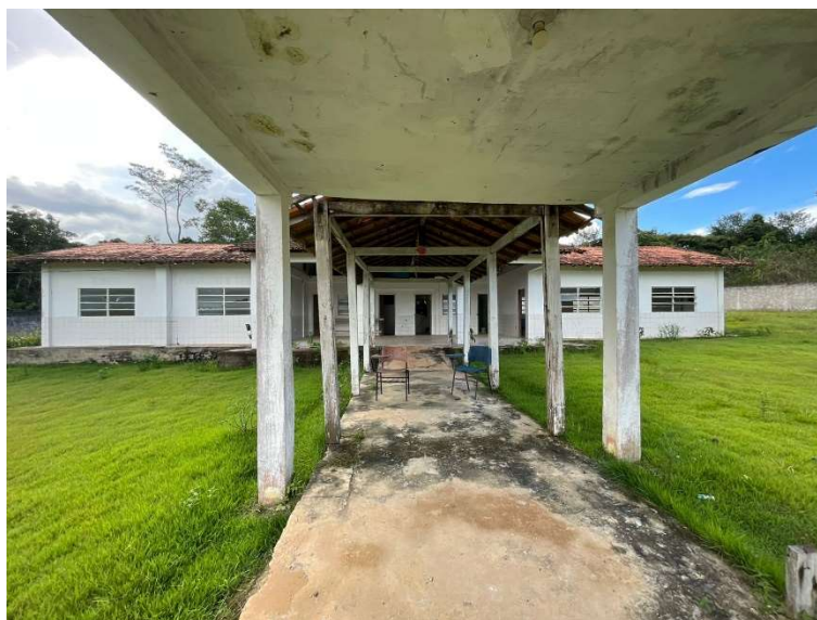
Imagem 01 – Passarela coberta.