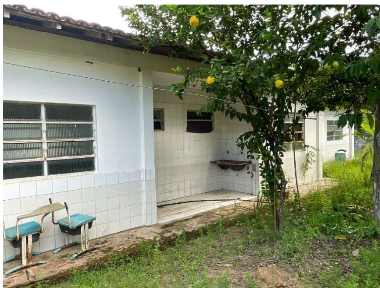
Imagem 09 – Área de serviço.